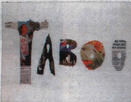
'Tabloid Taboo'. © Delphine Boël

Heel wat kunstenaars vertelen in hun werk hun eigen leven. Maar weinig kunstenaars trekken daarmee zoveel volk als Delphine Boël op haar tentoonstelling in Sint-Martens-Latem.